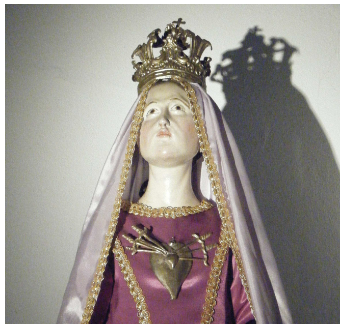
Pellegrinaggio Madonna Addolorata

Casa Beata Annunciata Suore Dorotee di Cemmo Via A. Cocchetti, 5 25044 Cemmo di Capodiponte tel. 0364 42000 - 42101